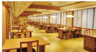
岩松旅館2階に新設した和ダイニング「喜悠」は広々とした空間に2名席7卓、4名席10卓を設ける

日時/9月29日 11:30から 会場/青葉区作並温泉元湯 岩松旅館1階 レストラン&多目的ホール[あすなろ] 定員/25名 料金/1万2000円(プラス5000円で宿泊可) 申込・問/岩松旅館 1a.022-395-2211 https://ssl.iwamatu-ryokan.com