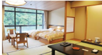
ベッドの配置も自然と変更できたり、部屋の隅に読書スペースも設けられる