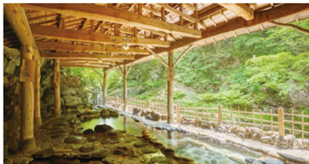
広瀬川渓流のすぐ脇にある天然岩風呂。4つの湯船があり、湯度や深さがそれぞれ微妙に違う。レディースDayでは全て女性専用となる

仙台市街地から車で約40分、作並温泉郷で最も古い歴史を持つ岩松旅館。4月に「青葉館」をリニューアルし、より利用しやすくなったと評判だ。女性限定の企画として9月4日㈫に「レディースDay」、29日㈫に食事を開催する。